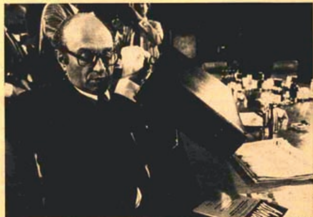
Otto Graf Lambsdorff: „Meine Überlegungen gehen über den konventionellen Rahmen der bisher als durchsetzbar angesehenen Politik hinaus... Die Entwicklung der Arbeitslosigkeit gebietet es aber, daß die Politik für die Wirtschaft einen neuen Anfang setzt...“