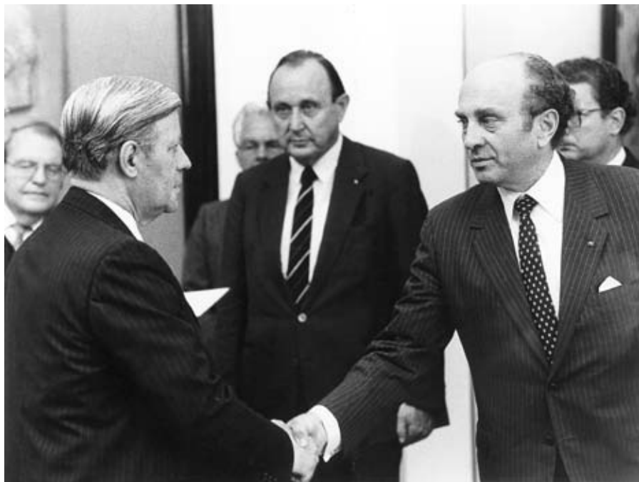
Helmut Schmidt verabschiedet sich nach der Überreichung der Entlassungsurkunde durch Bundespräsident Carstens mit Handschlag von Lambsdorff und Genscher (17.9.1982)

Helmut Schmidt, auf dessen Initiative es ja zu einer Regierungsangelegenheit geworden war, suchte den Schulterchluss mit seiner eigenen Partei und nahm die Ausarbeitung des Wirtschaftsministers zum Anlass, der FDP die Schuld am Scheitern der Koalition zuzuschreiben und damit die eigentlichen Ursachen für das Auseinanderbrechen seiner Regierung, nämlich diametral gegenüber stehende Grundsätze für die Überwindung der Wirtschaftskrise einerseits und zunehmender Dissens in der Außenpolitik andererseits, wider besseres Wissen zu verleugnen. Gut eine Woche nach Bekanntwerden des Lambsdorff-Papiers traten die FDP-Bundesminister zurück, drei Wochen später wurde der CDU-Vorsitzende Helmut Kohl an der Spitze einer CDU-FDP-Koalition mittels konstruktivem Misstrauensvotum zum Bundeskanzler gewählt.